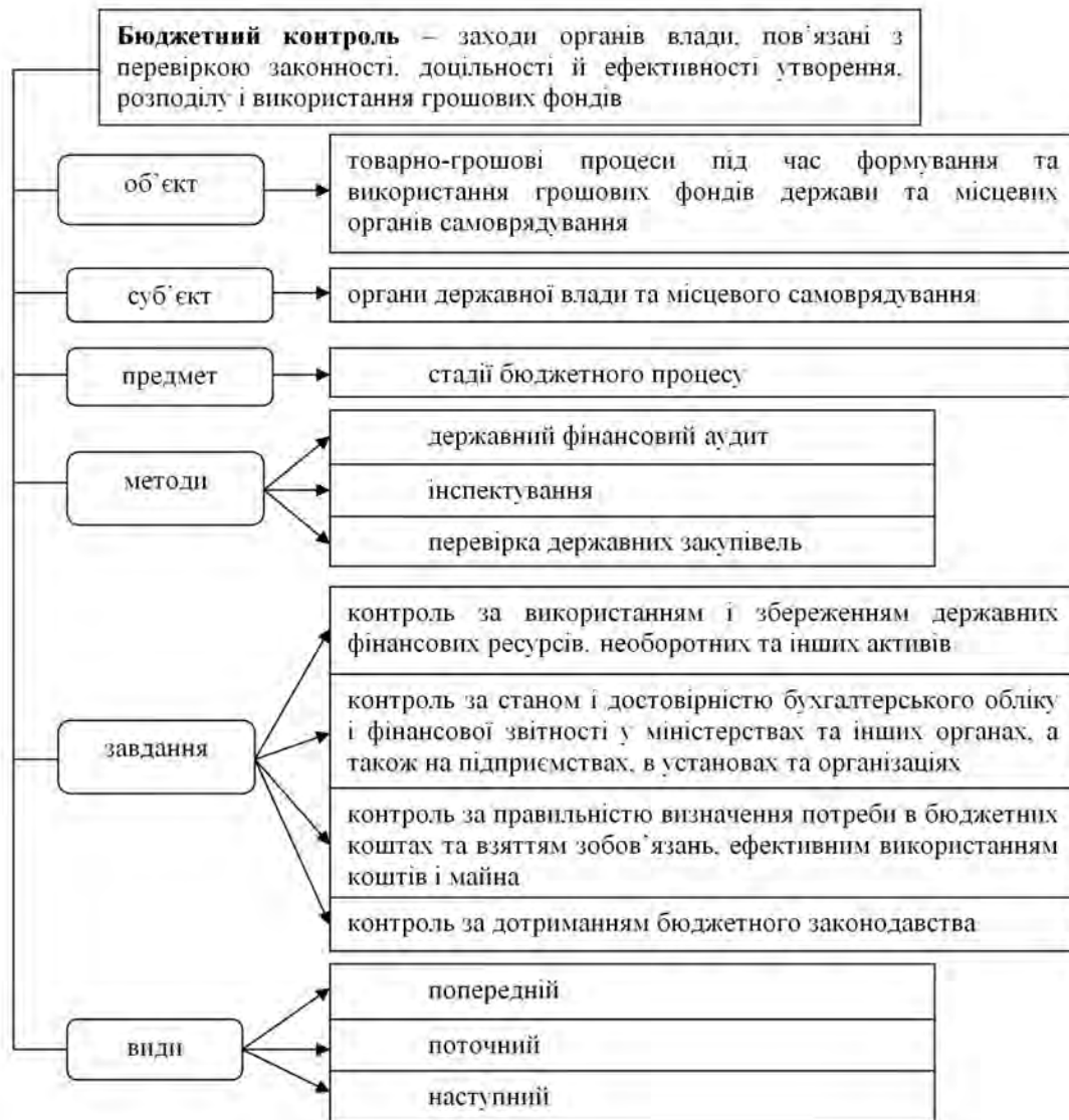
Рис. 1. Елементи системи бюджетного контролю* * – власна розробка

Коефіцієнтну методику визначення показників на цих етапах подає В. Симоненко 8 . Він пропонує визначати коефіцієнти результативності, дієвості контролю та окупності роботи контролера. Так, розрахунок коефіцієнта результативності контролю за формулою він пропонує здійснювати за формулою: